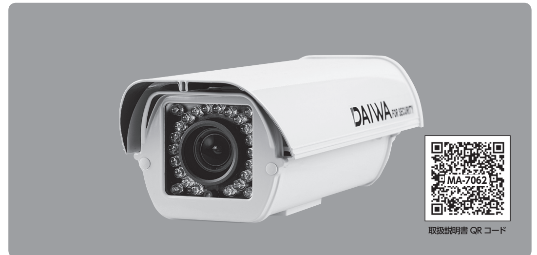
取扱説明書 QR コード

取り扱いに関する詳細は、当社 HP をご参照ください。 ご使用の前に「取扱説明書」をよくお読みのうえ正しくお使いください。